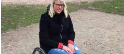
Nieuw gezicht in de gemeenteraad p. 2