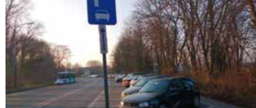
N-VA Halle neemt parkeerbeleid op de korrel p. 3