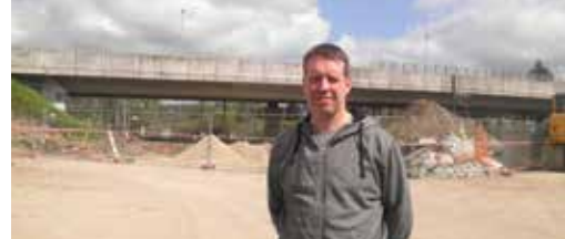
Geen zekerheid over parkeertoren NMBS p. 3