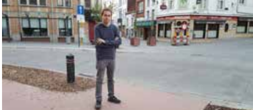
Meerderheid weigert zebrapad aan kruispunt p. 2