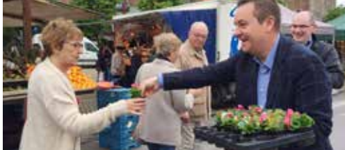
N-VA deelt plantjes uit p.2