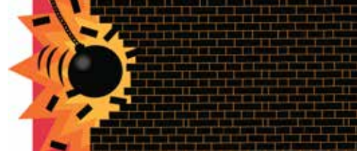
Slopen betere optie dan renoveren p.3